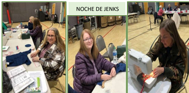
NOCHE DE JENKS

El grupo Jenks de la OHCE en Tulsa-Condado cosió almohadas para perros y gatos en una reunión reciente como un proyecto comunitario y pronto las entregará a un refugio local.