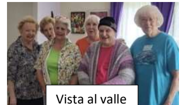
Vista al valle